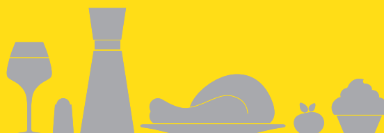
Tableau des valeurs Apetiz 2019